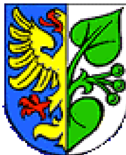
Statutární město Karviná